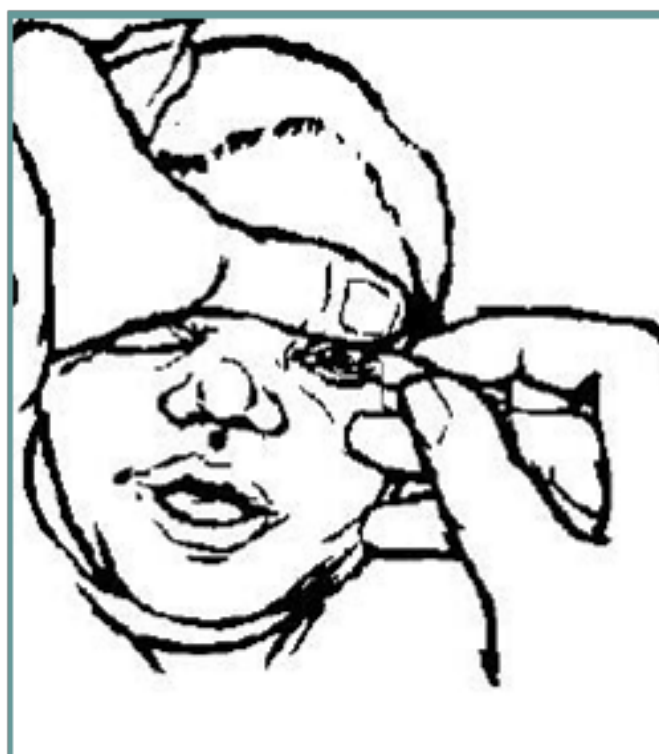
نحوه استفاده از پماد چشمی