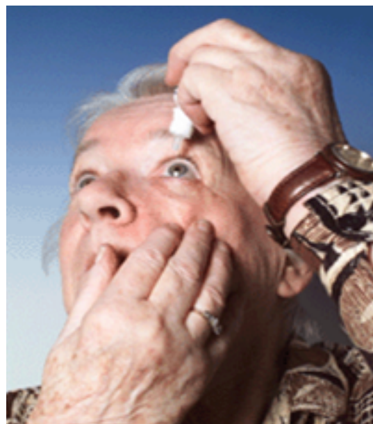
نحوه استفاده از قطره چشمی